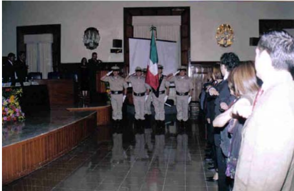
Honores a la Bandera por parte de la Escolta y Banda de Guerra

El Sábado 26 de Noviembre del 2005, la Confederación Nacional de Talleres y las 38 organizaciones de talleres automotrices afiliadas en el ámbito nacional, con apoyo del Gobierno Estatal y Municipal de Guadalajara, realizaron el evento de protocolo del “Premio Nacional a la Calidad 2005” para empresas fabricantes de autopartes, a las empresas seleccionadas en forma directa por mas de 19,800 encuestas realizadas a los talleres mecánicos de la nación, utilizando como sede para este evento el Majestuoso Salón Cabildo del Palacio de Gobierno de Guadalajara, Jalisco