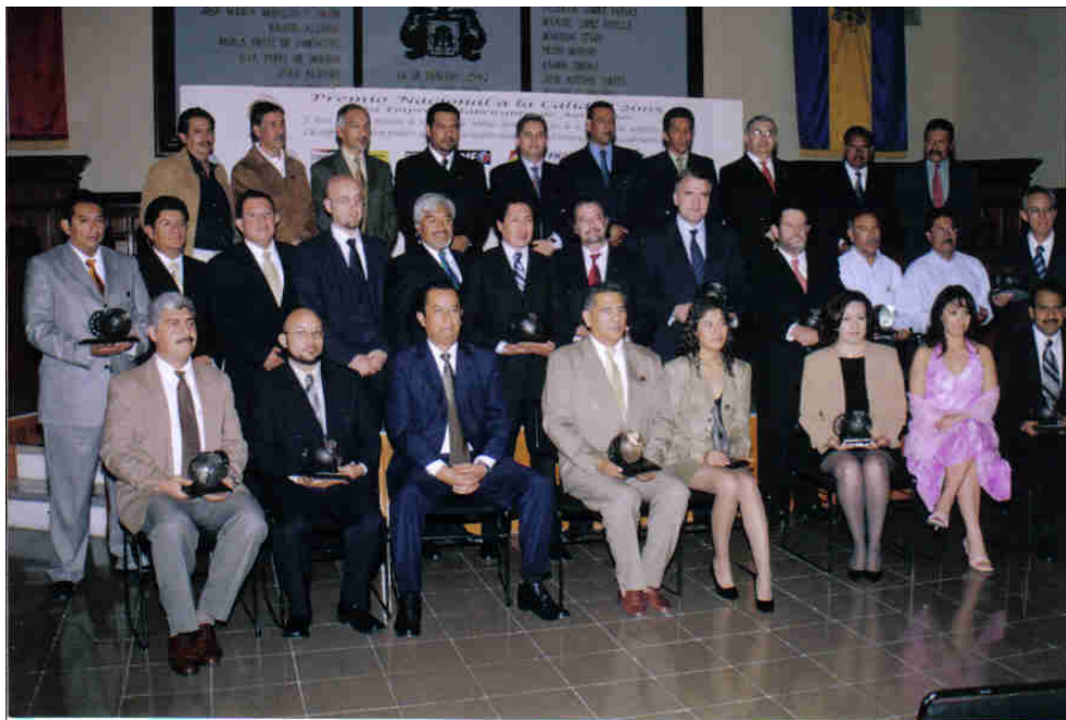
Grupo de Directivos de las Empresas Ganadoras del “Premio Nacional a la Calidad 2005” para empresas fabricantes de autopartes en compañía de los integrantes del Presidium

Para otorgar el “Premio Nacional a la Calidad 2006” las encuestas se iniciaran a partir del mes de Febrero de 2006 con un incremento en líneas a premiar. Se realizaran programas de apoyo a las empresas ganadoras mediante acuerdos tomados en mesa de trabajo previa a la entrega del premio y estrategias propias de la C.N.T a Nombre de la C.N.T Felicidades a las Empresas Ganadoras.