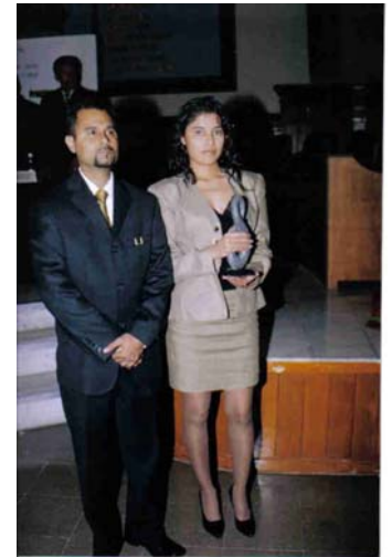
Auto Todo Distribuidor Galardonado