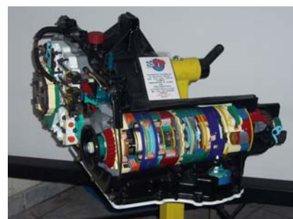
Prototipos Didácticos realizados por Guillermo Vázquez