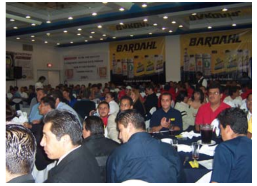
Se contó con lleno total en esta cena

El mismo día 29 de Agosto se ofreció una cena de gala para 500 asistentes miembros de la C.N.T. patrocinada por las empresas miembros del Consejo Certificador, contando con un presidium integrado por el representante del Gobernador del Estado de Jalisco y el representante del Presidente Municipal de Guadalajara, los directivos de las empresas del consejo certificador y los directivos de la C.N.T,