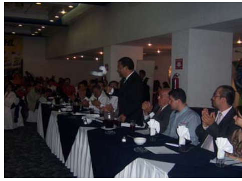
Presidium Integrado por Directivos y Autoridades