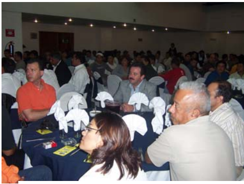
Asistentes a Cena de Gala