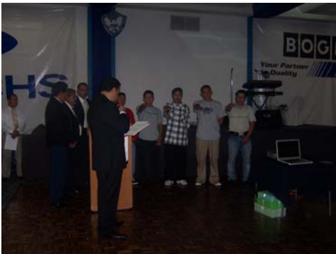
Toma de Protesta delegación Cortazar