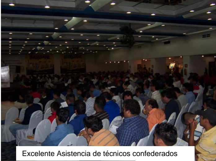
Excelente Asistencia de técnicos confederados

¡Excelente respuesta y participación de los técnicos confederados certificados se tuvo como resultado en el cuarto encuentro de actualización! realizado en las instalaciones del hotel Aranzazu Catedral Guadalajara, los días 29 y 30 de Agosto del 2007, con este evento se da continuidad al compromiso del programa de certificación nacional de calidad y servicio en mecánica automotriz en lo referente a la actualización permanente de los técnicos que han ingresado al programa de Certificación, este evento se realizo con el apoyo y patrocinio de las empresas miembros del Consejo Certificador, la SEP, y los directivos de la C.N.T , además se contó con la colaboración de los Gobiernos Estatal y Municipal de Jalisco.