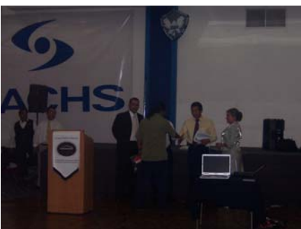
Rifa de parte de Ethos México y Fhasa

Se tuvo gran aceptación de los presentes para el show de Manny Manuel, quien extendió su presentación hasta dos horas y media para beneplácito de los técnicos confederados.