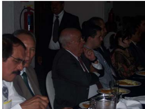
Representante del Gobernador