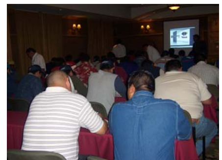
Aplicación de Exámenes de Certificación

Para iniciar el día 30 de Agosto se realizaron exámenes de certificación laboral para los técnicos visitantes, con excelente participación, lo cual ratifica el gran interés del sector productivo en certificar sus conocimientos y habilidades laborales.