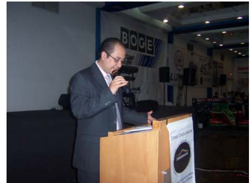
Representante del Presidente